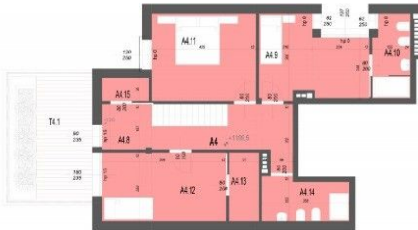
RZUT II POZIOMU